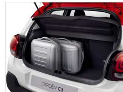
Volum portbagaj: 300 litri